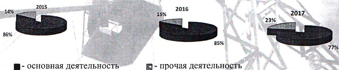
Рис. 1. Структура выручки от продаж за 2015-2017 гг.

На рисунке 1 видно, что доля доходов полученные от оказания услуг по техническому обслуживанию и текущему ремонту электросетевого оборудования в общей структуре доходов уменьшается с 86% в 2015 году, 85% в 2016 году до 77 % в 2017 году. Это связано с увеличением объемов строительно-монтажных работ.